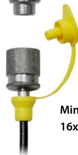
Minimesse-Schlauch 16x2 (800 mm)