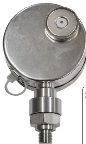
mit Magnet- Haltevorrichtung